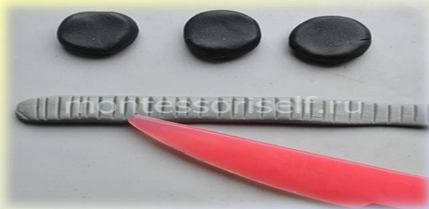
Заготовки для гусениц танка

Скатываем маленькие черные шарики. Превращаем их в лепешки. Раскатываем серую тонкую колбаску. Сплющиваем ее и делаем стеклом насечки — это заготовки для гусеницы танка.