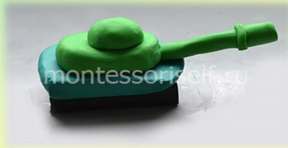
Корпус танка с башней и пушка

Из черного и зеленого пластилина лепим корпус танка с башней. Из зеленого пластилина, раскатанного колбаской, делаем пушку.